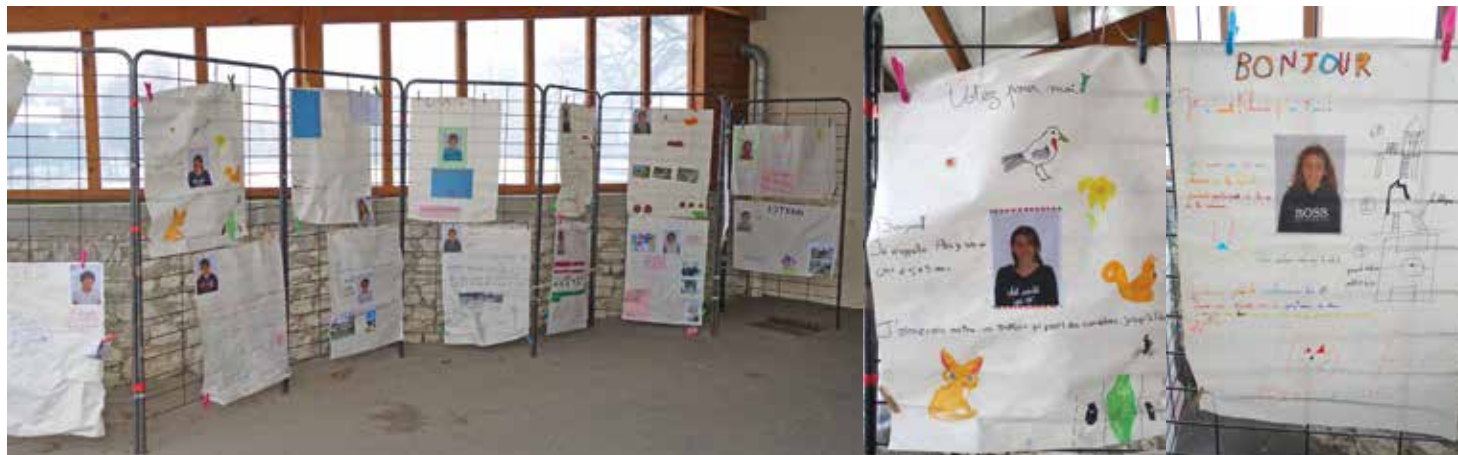
Quelques affiches de la campagne

Nous avons eu le grand plaisir de recevoir 21 candidatures, bien réparties (voir l'encadré "règlement intérieur"). Les enfants ont été aidés pour définir leur programme, préparer une affiche électorale et leur discours pendant que les conseillers municipaux continuaient en expliquant aux plus jeunes (du CP au CE2) qu'ils allaient devoir voter.