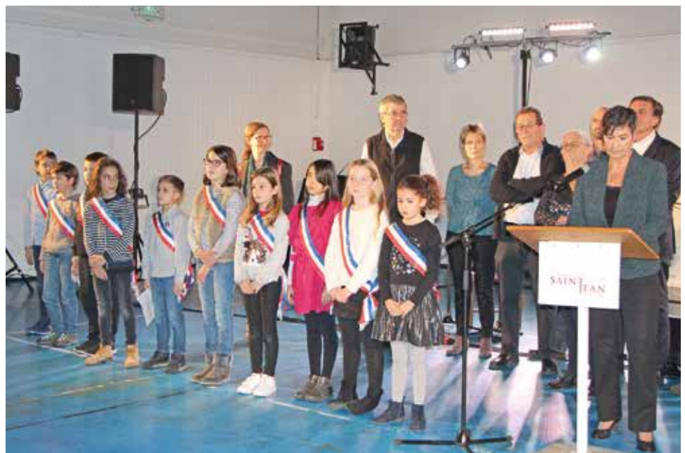
Lors de la cérémonie des vœux, presque tous les enfants du CME étaient présents (bien que ce soit encore les vacances scolaires) ; ils ont profité de cet événement pour se présenter à la population saint-jeannaise.

Le Conseil Municipal des Enfants, c'est voter et être élu. C'est s'investir, choisir, porter un projet. C'est pour eux, n'en doutant pas, grandir à l'école de la vie publique et de la citoyenneté.