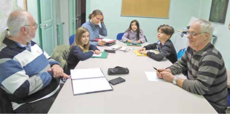
La première commission s'est tenue fin janvier

rappelé les actions qui leur tiennent à cœur, les enfants se sont répartis dans 3 commissions :