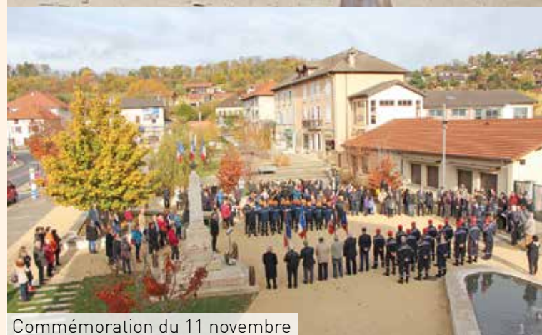
Commémoration du 11 novembre