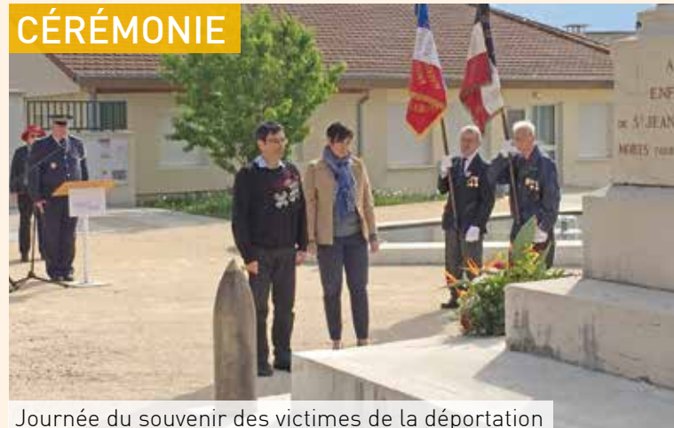
Journée du souvenir des victimes de la déportation