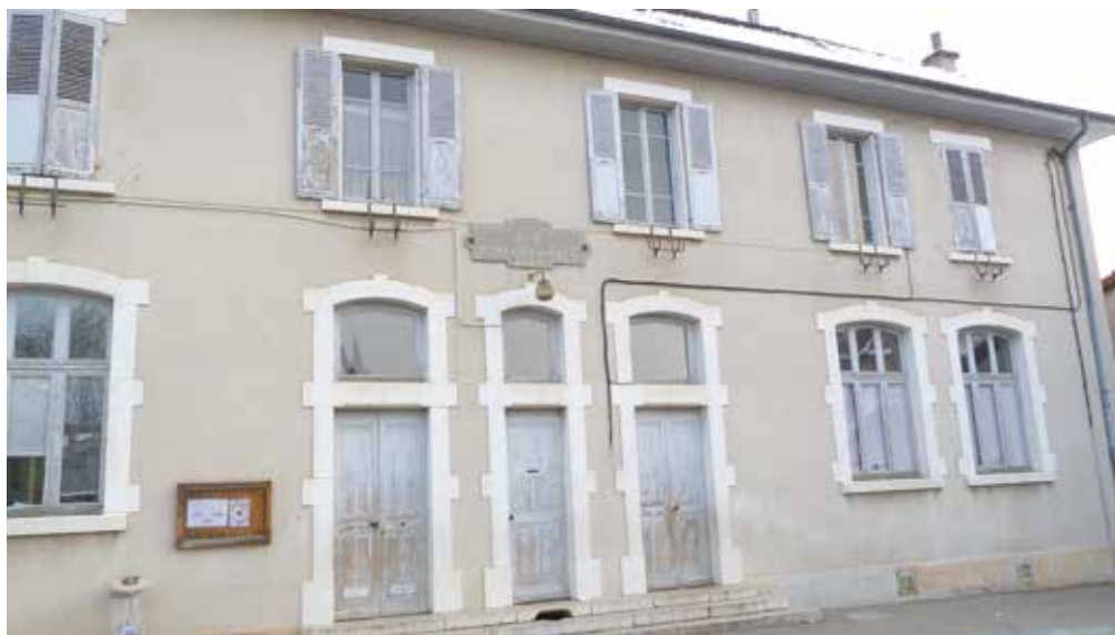
L'ancienne école des filles

Alors pourquoi avoir choisi, il y a quelques années, cette réalisation minimaliste de trois petites classes pour notre École communale ? Nous osons espérer qu'il ne s'agissait pas alors d'une volonté délibérée de contourner les moyens accordés à l'École Publique. Quoiqu'il en soit, nous affirmons ici qu'il n'y a pas de prospective, pas de stratégie, pas de "bon sens" sans un fondement politique explicite est solide. Le nôtre, fait des valeurs républicaines, laïques, émancipatrices et solidaires, ne nous aurait sans aucun doute pas conduits à négliger de la sorte l'École Publique.