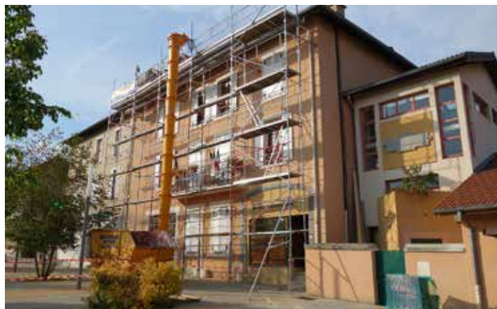
Rénovation de l'école