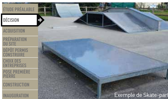
Exemple de Skate-park