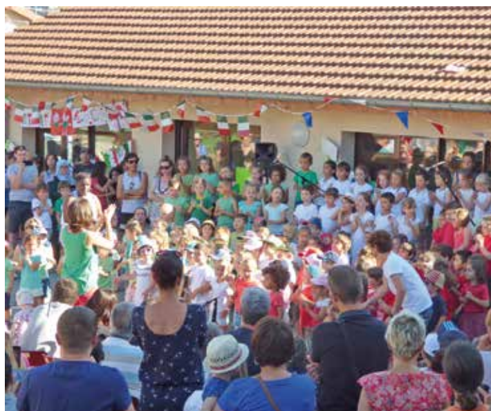
Chorale de l'école aux couleurs italiennes

Fondons l'espoir que les jeunes générations s'investiront dans ce jumelage, afin d'y apporter un regard nouveau.