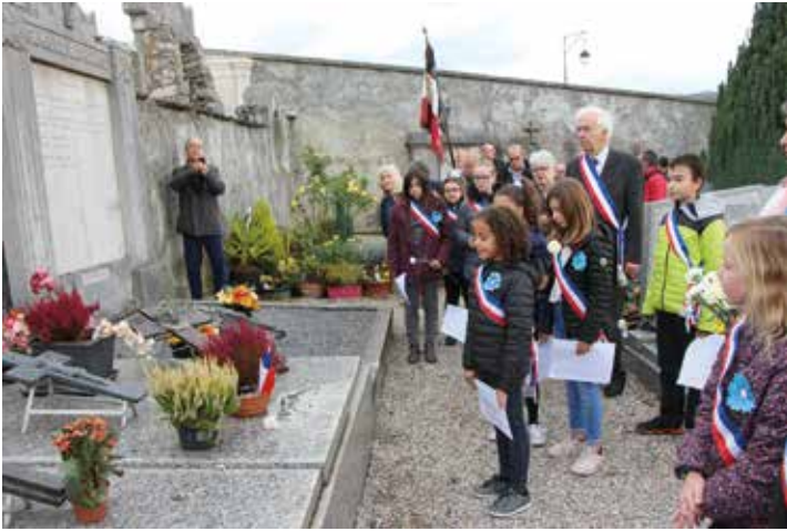
Dépôt d'œillets sur les tombes des poilus par les enfants du CME