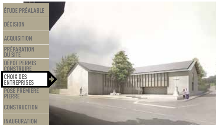
Rue du Billoud / Chemin de la Mirabelle