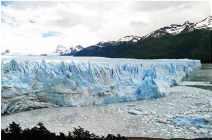
Retrait du glacier il y a 20 000 ans

Une petite ballade vous permettra peut-être de rencontrer le plus gros bloc erratique déposé par le glacier il y a environ 15 000 ans .