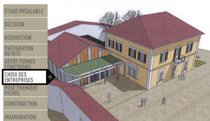
Place du Champ de Mars