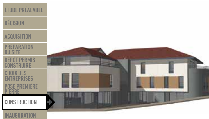
Place du champs de Mars