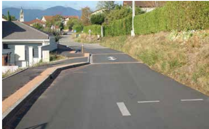
Cheminement piétonnier des Nugues