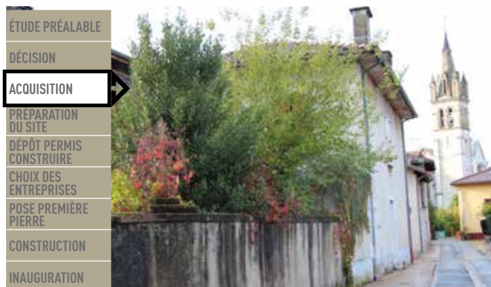
Rue Soffrey de Callignon