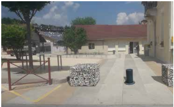
Projet d'installation de bornes escamotables (infographie ci-dessus)

48 000€ pour la réfection de la toiture de l'école