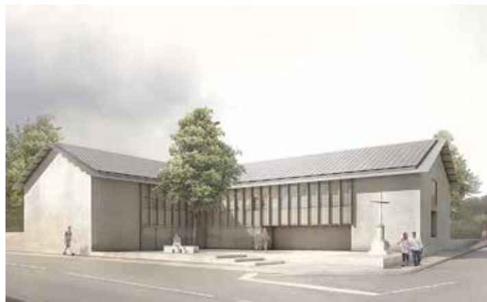
Maison pour tous

284 400 € pour la construction du "petit café"