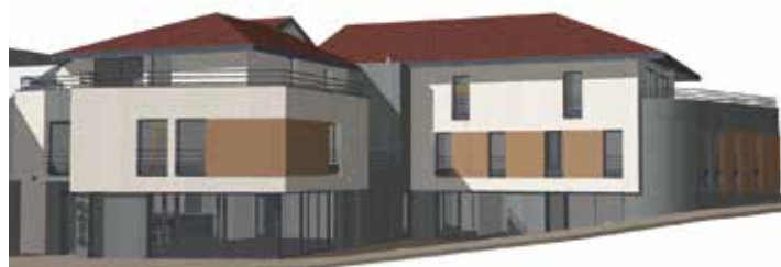
Maison de Santé Pluriprofessionnelle , café et logements

400 000 € pour la construction de la Maison de Santé Pluriprofessionnelle