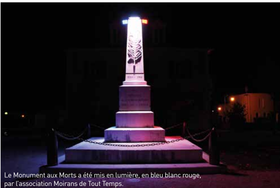
Le Monument aux Morts a été mis en lumière, en bleu blanc rouge, par l'association Moirans de Tout Temps.

Se rappeler n'est pas toujours facile, car certains souvenirs sont douloureux ; mais oublier, c'est accepter le risque que cette douleur se reproduise un jour. Alors, résolument, je choisis la mémoire.