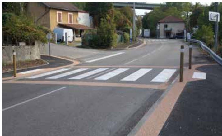
Sécurisation piétonnière du carrefour du Scey (RD 592)