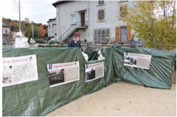
Reconstitution d'une tranchée par les services techniques de la commune