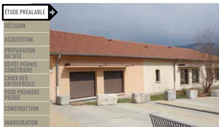
Place du Champ de Mars